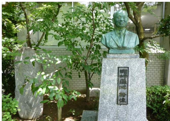
～外来受付前 初代院長胸像と松尾芭蕉句碑～